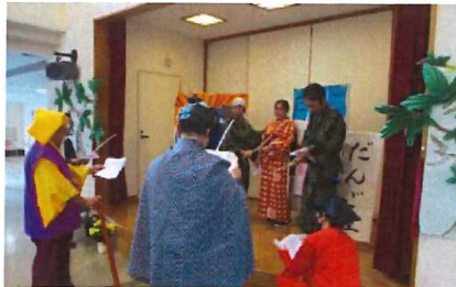
この紋所が目に入らぬか〜