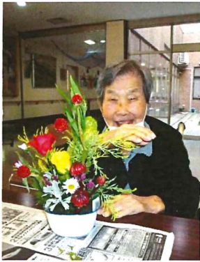
これは私の自信作です こんな素敵にできました