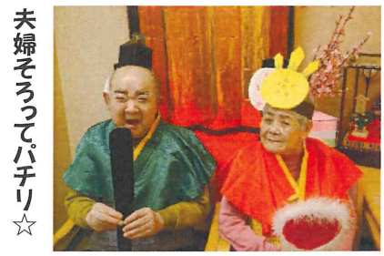
夫婦そろってパチリ☆