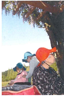
雲一つない青空。藤棚の下で休憩。

と藤の花を観るたびに、感動の声。花の蜜を求めてやってくるハチたちには、驚きの声があがり、活気に満ちた外出で気分転換ができたと思います。