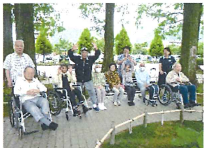
風が気持ちいいね〜