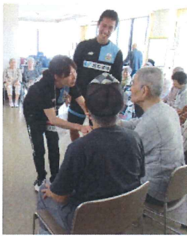
FC岐阜の スタッフの皆様 ありがとうございます

ボールを使って準備運動を行い、体操の準備は万全!足を使った体操は、足をうまく動かすことが難しく、ボールが放れて何個か床に転がっていました。ボールを蹴りゴールが決まると、何度も歓声があがり、皆様の活気あふれる姿が印象的でした。